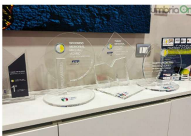
I trofei del memorial 'Massimo Vicario'